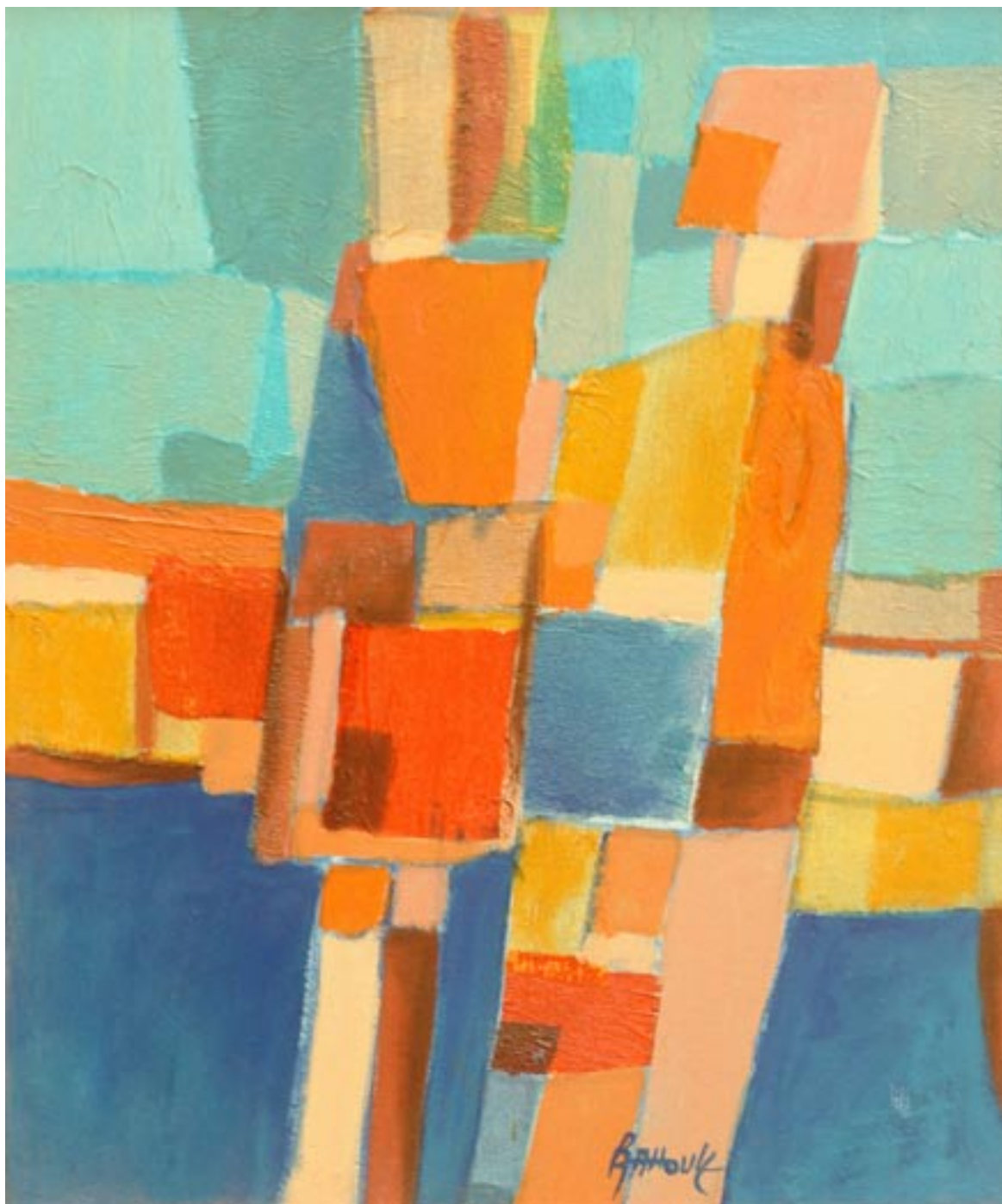
Huile sur toile. 90 x100 cm. 2004