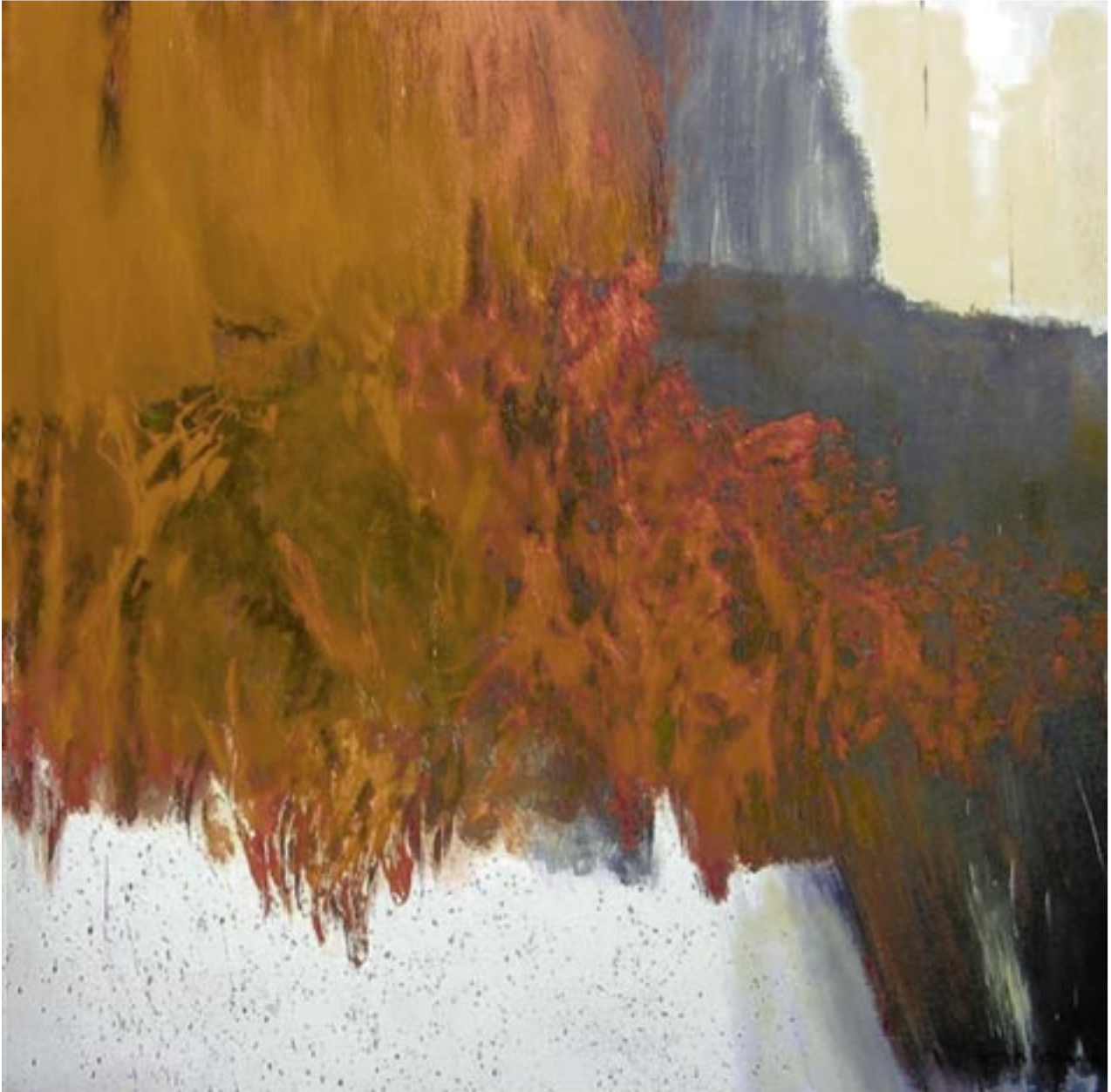
Huile sur toile