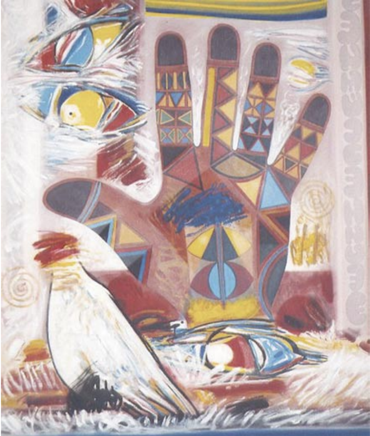
Huile sur toile