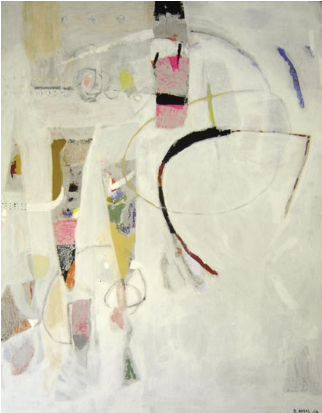
Composition. Acrylique et collage sur toile. 70 x 100 cm. 2006