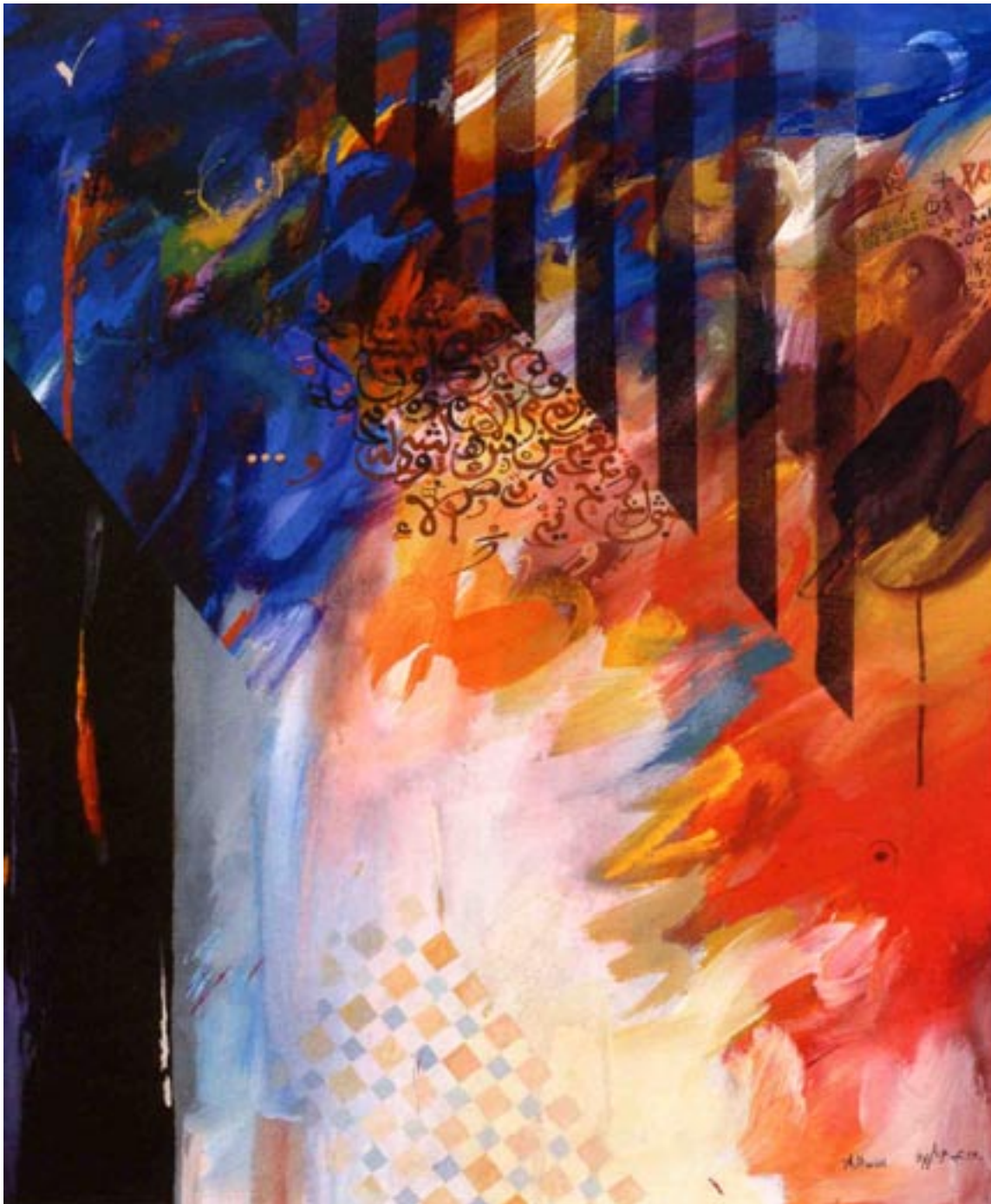
Huile sur toile